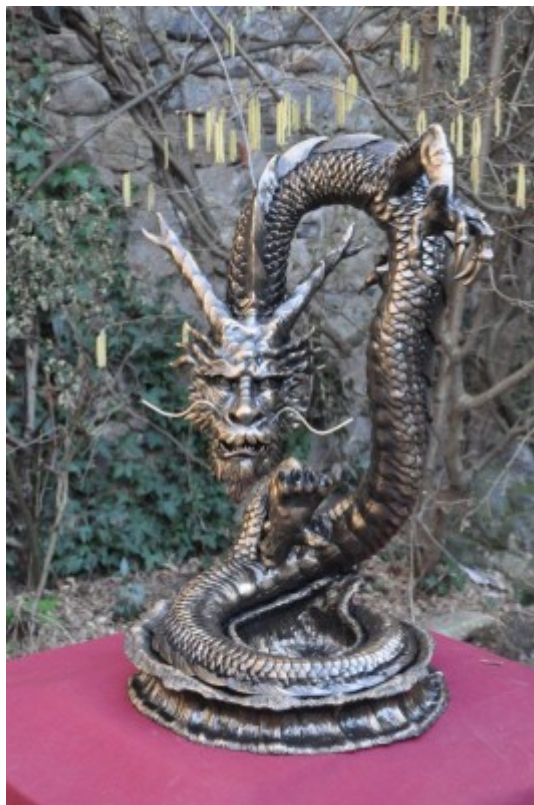
Dragon - Atelier Fantastic'Art (cliquer pour agrandir)