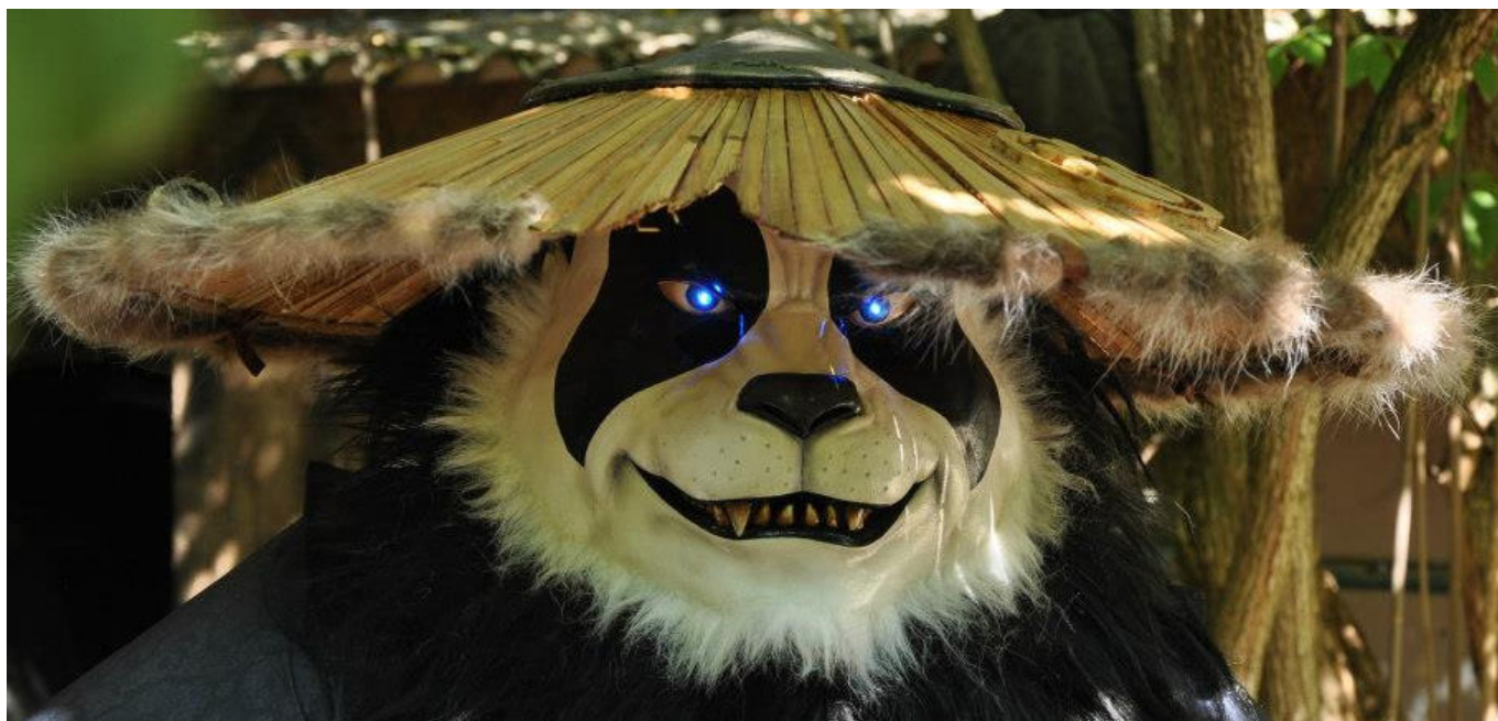
Pandaren - Blizzard