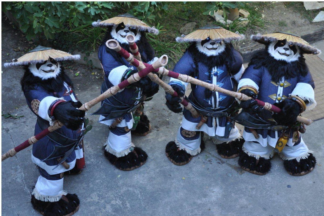
Costume de Pandaren, Atelier Fantastic'Art - Blizzard